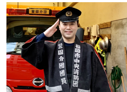
▲今年も地域の安心・安全のために頑張ります!

この消防出初式、消防職員や消防団員の防火・防災に対する士気を高めるだけではなく、市民の皆さんに消防への信頼や防災意識を高めてもらうことを目的として実施されています。私も念頭にあたり、引き続き地域防災活動に取り組んでいく決意を新たにしました。