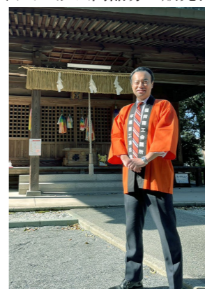
▲皆さんと一緒にまちづくりを進めます!

また、活動拠点となる山荘通り(県道松原比恵線)については、歩道の拡幅や電柱の地中化が着々と進み、更なる賑わいを生み出す環境が整いつつあります。今後、ベンチやフラワーポッドの設置など、通りを歩く方々にとって快適な環境づくりに取り組んでまいります。皆さんも、素敵な山荘通りを実現するために、様々なアイデアを平尾商工連合会にお寄せください!