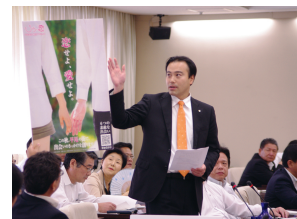
▲商店街の取り組みも紹介しました!

「少子化対策や晩婚化対策、居住促進という視点は言うに及ばず、『福岡で結婚して幸せに暮らしていきたい』という独身男女の志向を詳しく分析するとともに、少しでもその出会いや結婚を支援していく具体的な取り組みを検討すべき」と要望。「次年度から、独身男女の結婚に関する志向について実態を把握するとともに、(地域や商店街が実施する恋活・婚活イベントについては)福岡市ホームページなどにおいても広報支援や情報提供などに取り組む」という前向きな答弁を得ました。