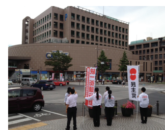
▲大通りで演説する学生部(北九州市)

キャラバンには、友好議員がこの時期に受け入れているインターンシップ大学生も参加。実際にマイクを握って熱弁をふるう姿は頼もしい限りでした。学生部をはじめ、次世代の日本を担う学生たちの今後の活躍にご期待ください!