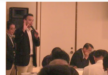
▲活動報告後、参加者の質問に答える様子

参加者のみなさんから頂いたご意見は、今後のローカルマニフェスト実現に向けて参考にさせていただきます。まずは、今秋にも市長宛に提出する「平成25年度予算要望」の内容に活かしていきたいと思っております。