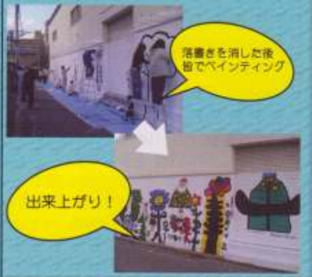
落書きを消した後に白ペンキでペインティング