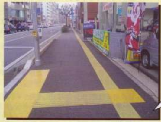
歩道の拡充や生活道路の整備も重要!

財政状況が厳しい中で、今後、仮に予算が縮小されても本市行政の中で土木行政の優先順位は高いのであれば、やはり市民の意見を踏まえた計画策定が必要だと思ふ。限られた予算の中で道路整備を実施していくには、幹線道路整備、生活道路整備、既存道路の維持管理の3分野に対して、それぞれ予算をどのように割り振っていくかということについてしっかりと議論して、有効な道路整備、土木行政を進めていくよう要望しておく。