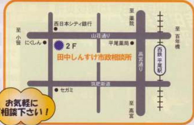
お気軽にご相談下さい!